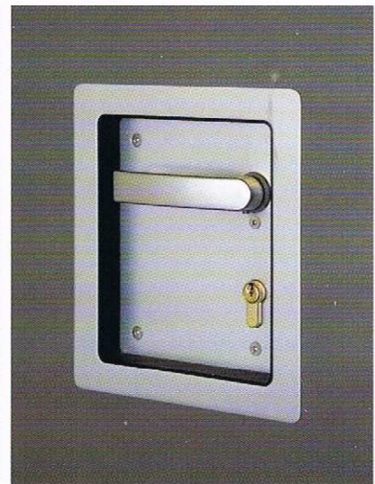
Detalle de pomo y cerradura.