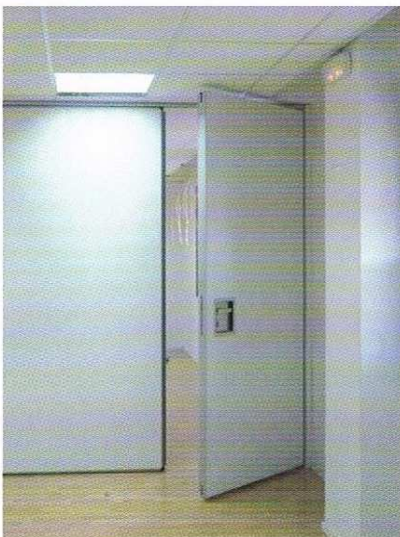
Puerta panel batiente.