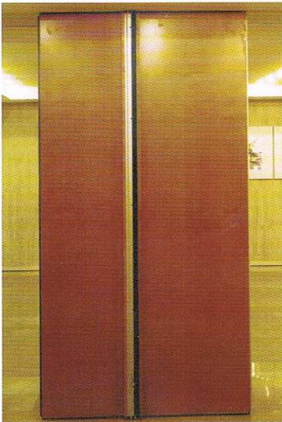
Módulo en T.

Las compartimentaciones múltiples, precisan con frecuencia módulos en "L", "T" y "+" para cumplir todas las exigencias de distribución. También se suministran módulos columna en "+".