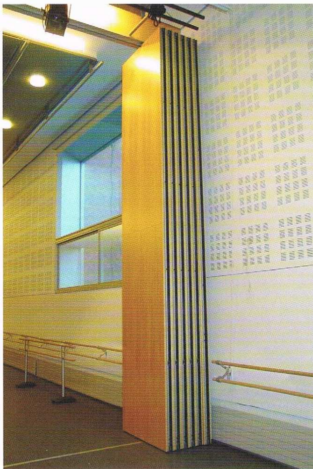
Detalle operación de cierre tabique monodireccional.